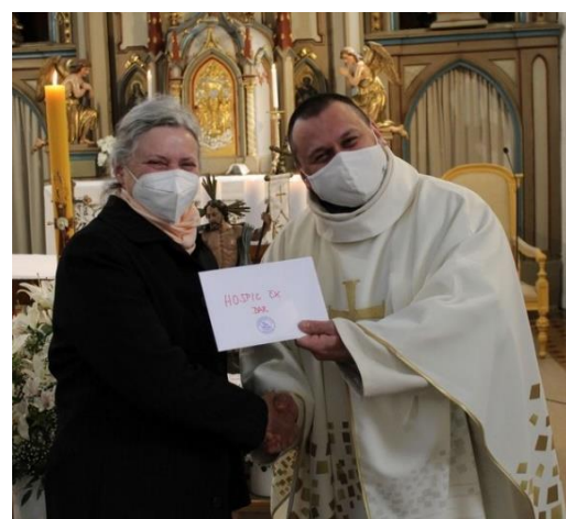
Předávání daru z „Postní almužny“ pracovníkům Hospice Anežky České v Červeném Kostelci při mši svaté ve čtvrtek 22. května

Web: dolnocermenska.farnost.eu , farnostsnu.cz nebo pohadkovafarnost.cz Číslo účtu farnosti: 155816135/0300 Děkujeme za Vaše příspěvky.