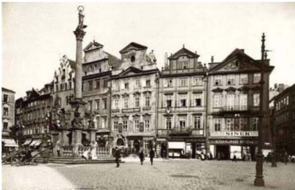
Sloup byl vysoký téměř 14 metrů a nesl dvoumetrovou pozlacenou sochu Panny Marie.