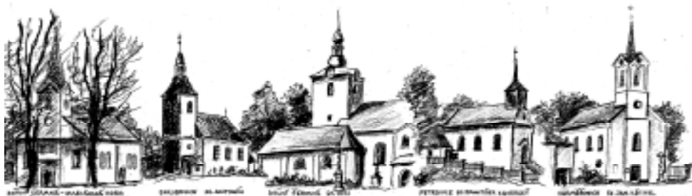
СВЯТЫЙ МЕТОДИЙ - СВЯТЫЙ ЦЫРІЛ

Zůstanem věrni Církvi milované! Dědictví otců zachovej nám, Pane!