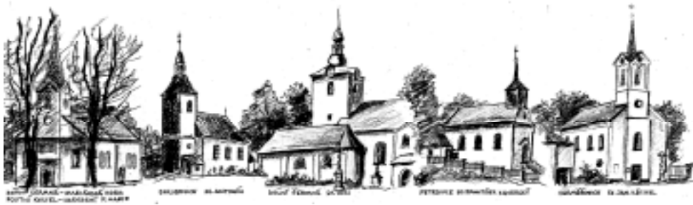
SV. VÁCLAVSKÝ KOSTEL V PRAZE

Tys svůj národ vždycky chránila, když mu bída, nouze hrozila, i nyní slyš prosby dětí svých, neopouštěj je v dobách zlých.