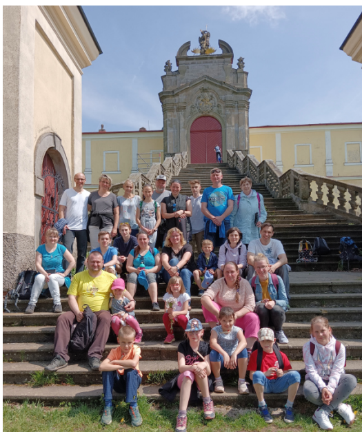
20. května - pouť na Horu Matky Boží u Králík