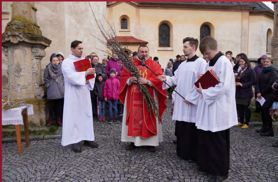
Květná neděle 2. 4. 2023